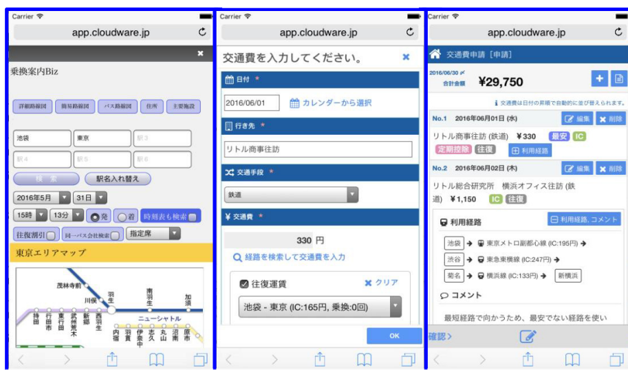
※スマートフォン画面