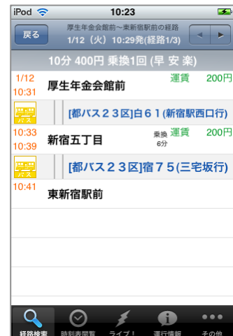
▲バスを乗り継いだ経路の検索も可能です。