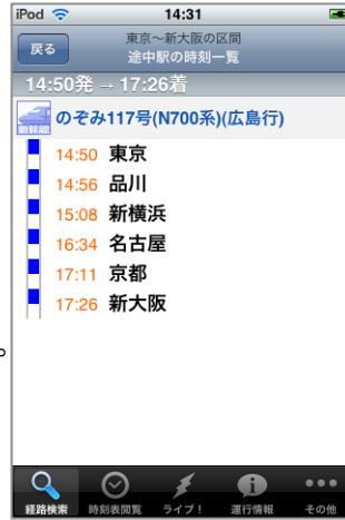
【途中停車駅の時刻一覧】