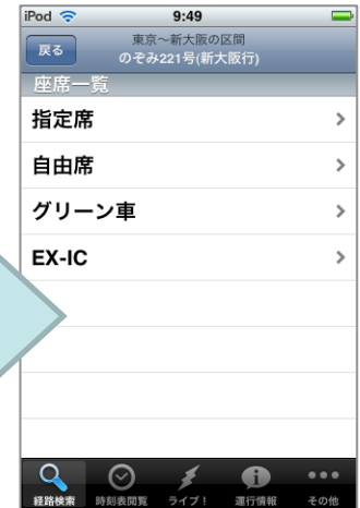
▲ 経路検索結果の画面から列車の座席を変更