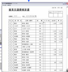
乗換案内旅費精算

インターネット経由で運行情報の閲覧と世界のエアラインを検索できる海外モードを使用できます。